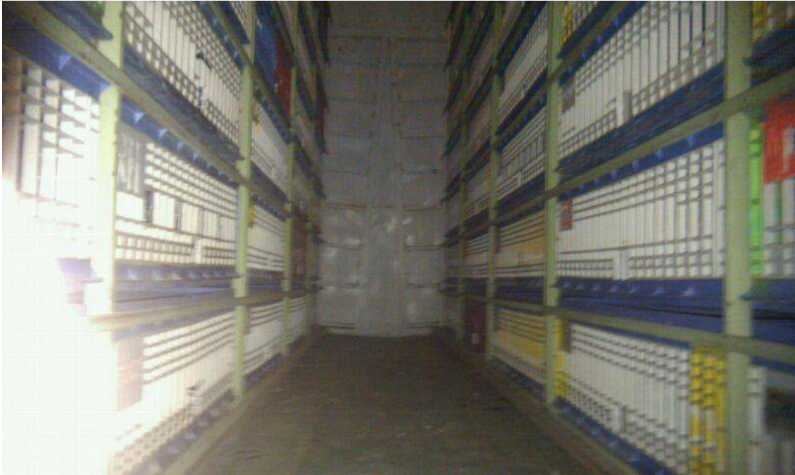
Vista interior del camión una vez con las cestas dentro, listo para salir.