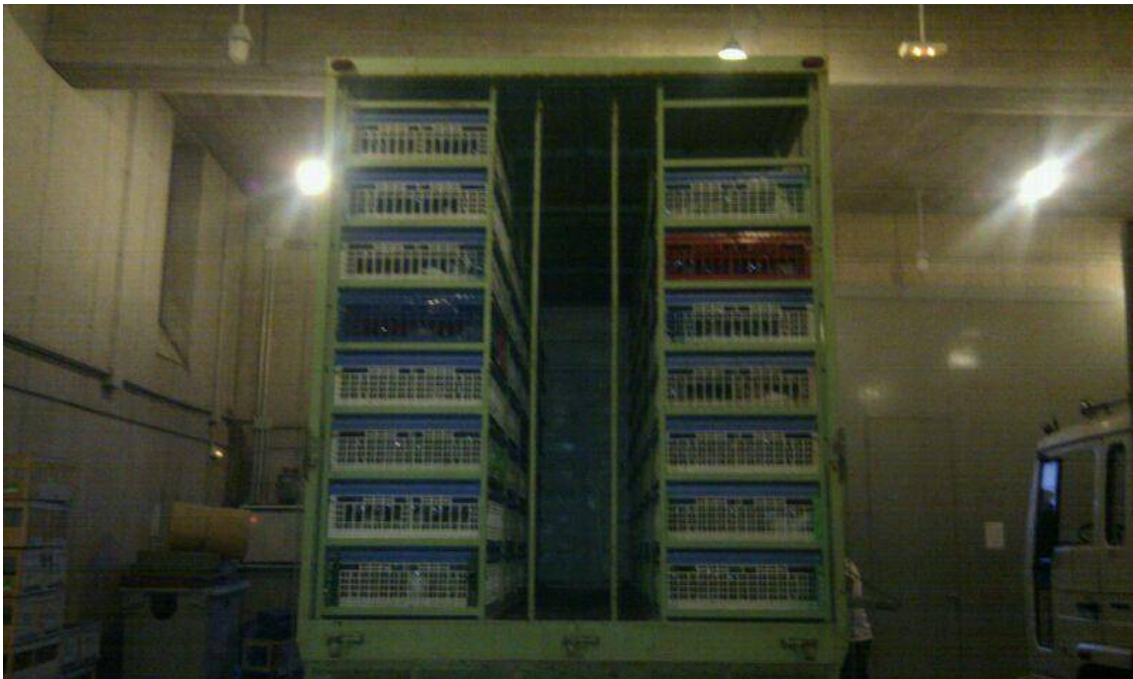
Vista exterior del camión con las cestas ya cargadas.